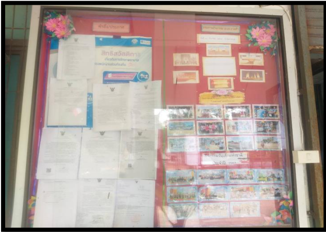
จดหมายข่าว